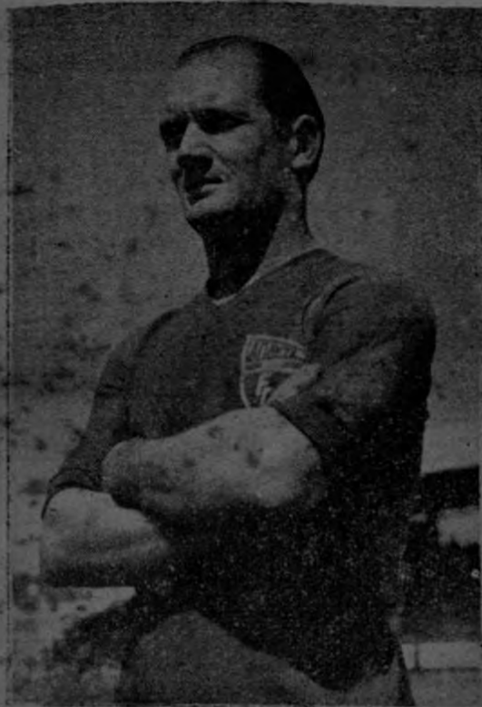
MARTIN VENTOLRA, estrella de reflejo en el fútbol mundial. El jugador que Costa Rica ansiaba ver y que es el más prestigiado de cuantos trae "Atlante".

En los círculos futbolísticos la noticia de que el traslado del Atlante ya estaba definitivamente arreglado fué recibido con notoria entusiasmo. Se temía que, por dificultades en el transporte la serie México-Costa Rica quedara cancelada definitivamente. Pero nuestros dirigentes futbolísticos, especialmente el Consejo Nacional de Educación Física no se dió descanso, y los pormenores que estaban dificultando la temporada fueron zanjados definitivamente. Así, pues, en la semana entrante tendremos en esta capital al famoso Atlante de México. La arribada del cuadro está arreglada en la PAA y ocupando el avión ordinario y también el directo la llegada será en tres tandas, los días 25, 26 y 27 de mayo entrantes.